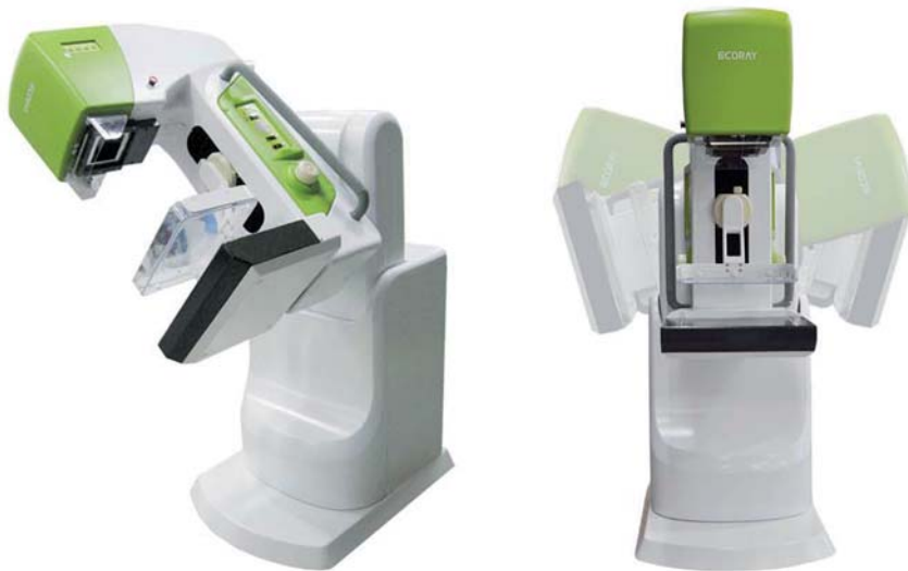
Rotation +180°/ -179° (Motorisé)